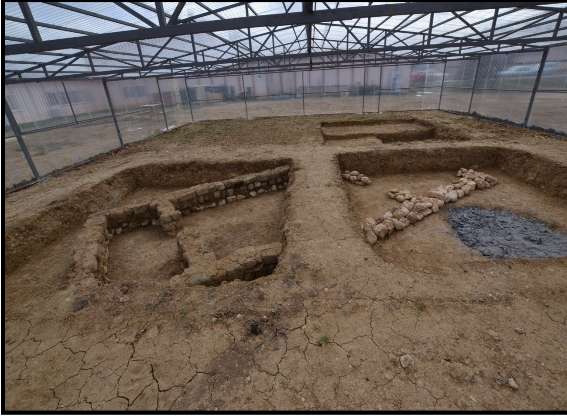
Arkeoloji Uygulama Alanı yapay megaron yapısı